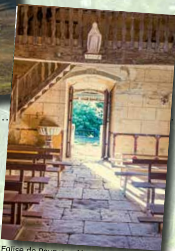
Eglise de Peyrusse-Massas