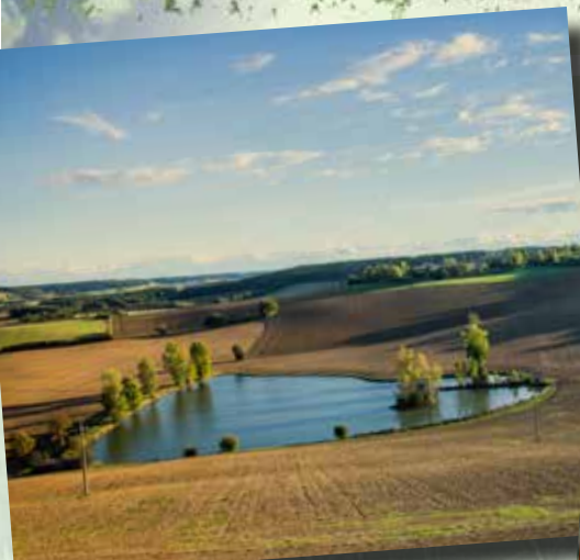
Vue de Peyrusse-Massas

Variante : Circuit de 6 km, traverser le ruisseau sur une passerelle en bois, tourner à droite sur la digue du lac, remonter vers la route en traversant un bois et emprunter la route à gauche pour retrouver le village.